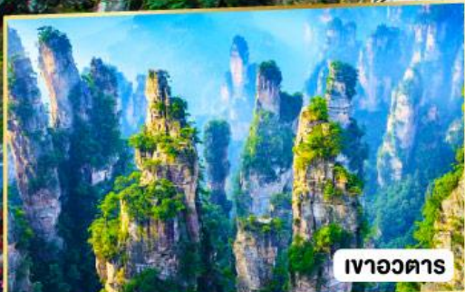
เาอวดตาร