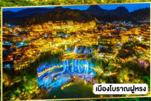
เมืองโบราณผุ่รง

เที่ยวครบสองเา เสน่ห์สองเมืองโบราณ ผุ่รงเจิน เฟิ่งหวง 5 วัน 4 คืน