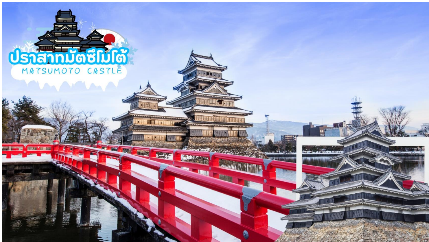
ปราสาทมัตสึโมโต้ MATSUMOTO CASTLE

หลังจากนั้น ออกเดินทางสู่ เมื่องมตสเมเต เบนเมืองที่สามารถท่องเที่ยวได้ทุกฤดูกาล ตั้งอยู่ตอนกลางของจังหวัดนากาโน่ เคยเป็นเจ้าภาพจัดการแข่งขันโอลิมปิกฤดูหนาวปี 1998 มัตสึโมโต้ตั้งอยู่บริเวณเชิงเขาของเทือกเขาแอลป์ญี่ปุ่น จึงทำให้เมืองทั้งเมืองถูกโอบล้อมไปด้วยภูเขาน้อยใหญ่ใจกลางประเทศญี่ปุ่น