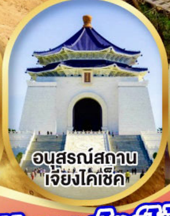
อนุสรณ์สถาน เจียงไคเช็ค