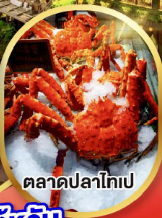
ตลาดปลาไทเป