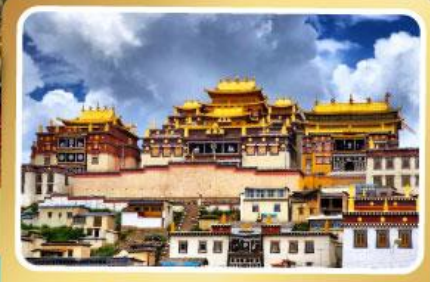
วัดลามะชงจ้านหลิง