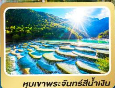
หุบเขาพระจันทร์สีน้ำเงิน