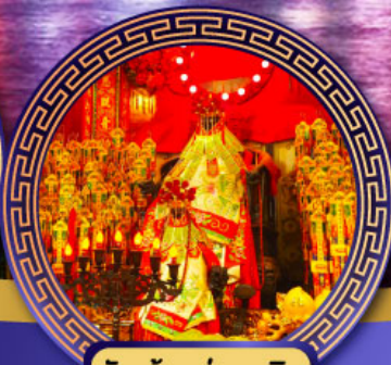
วัดเจ้าแม่กวนอิม ฮองฮ่า