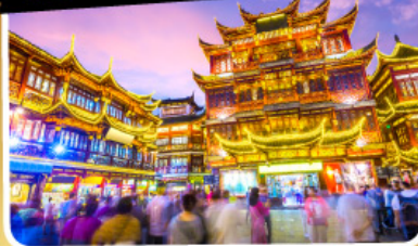
ตลาดร้อยปีฉงชิ่งเหมียว