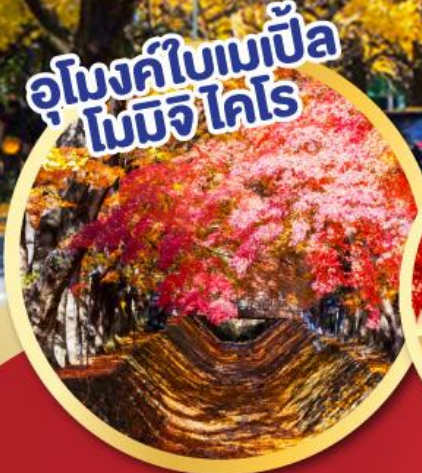
อุโมงค์ใบเมเปิ้ล โมมิจิ โคโร

ประกันสุขภาพ และอุบัติเหตุ ไทยวิวัฒน์ GTIP Plus (Gold Plan) คุ้มครองสูงสุด 3,000,000 *เงื่อนไขขึ้นอยู่กับอัตราค่าเบี้ยประกัน