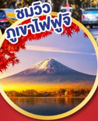
ชมวิวกุมาไฟฟูจิ