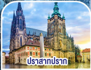
ปราสาทปราท