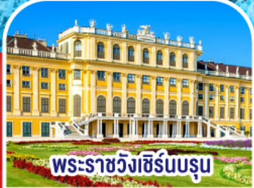
พระราชวังเชิร์นบรุน