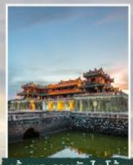
เว้ พระราชวังไตโน้ย