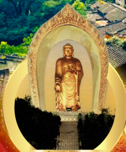
พระใหญ่ตงหลิง