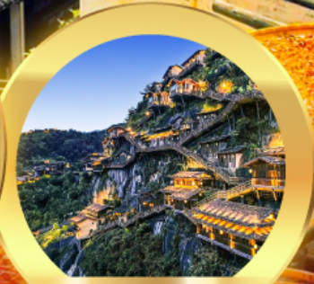
หุบเขาเทวดา