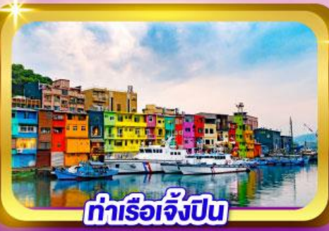
ท่าเรือเจิ้งปิน