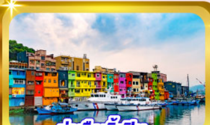
ท่าเรือเจิ้งปิน