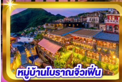
หมู่บ้านโบราณจิวเฟิ่น