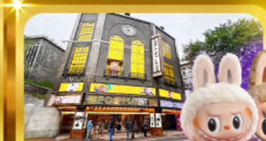
ร้าน POP MART ที่ใหญ่ที่สุดในไต้หวัน