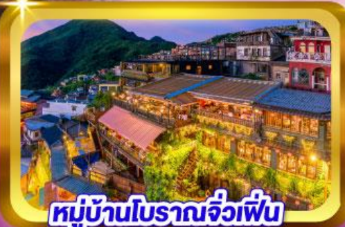
หมู่บ้านโบราณจัวเฟิน