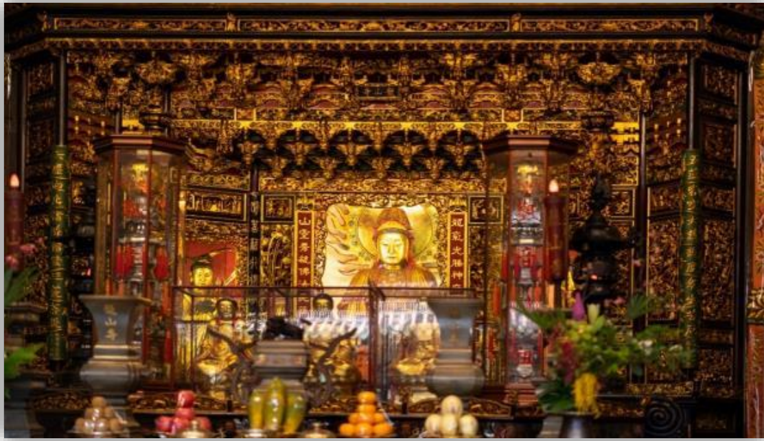
งามและมีคุณค่า และเสือกี่คู่ที่

นำท่านช้อปปิ้ง ร้านสร้อยสุขภาพ Germanium Shop ที่ขึ้นชื่อเรื่องสร้อยข้อมือ ที่ประกอบไปด้วยแม่เหล็กแร่ก้อนธาตุเจอร์มาเนียม ที่มีคุณสมบัติ ทำให้เลือดลมเดินดีขึ้น เพิ่มความกระปรี้กระเปร่า และคลาย ความเครียด รวมถึงปะการังแดง ปะการังน้ำลึก ที่เป็นอัญมณีล้ำค่าที่หายากซึ่งมีอยู่ไม่กี่ที่ในโลก