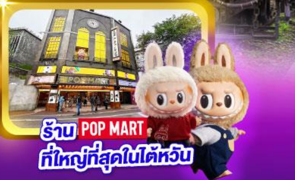
ร้าน POP MART ที่ใหญ่ที่สุดในไต้หวัน