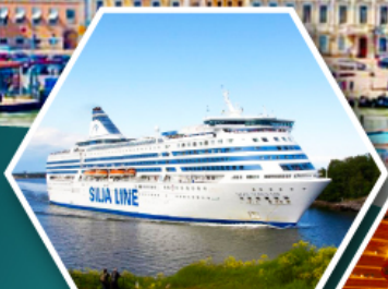
เรือสำราญ TALLINK SILJA LINE