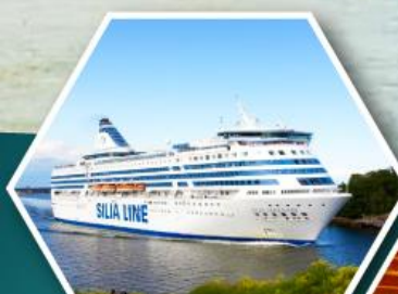
เรือสำราญ TALLINK SILJA LINE