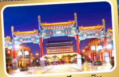
ถนนโบราณเทียนเหมิน