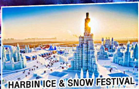
HARBIN ICE & SNOW FESTIVAL