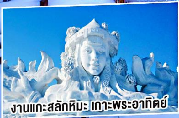
งานแกะสลักหิมะ เกาะพระอาทิตย์