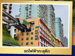
รถไฟฟ้า-ลูตึก