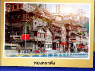
หอยทงยี่ตัง