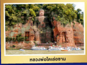
หลวงพ่โตเล่อซาน