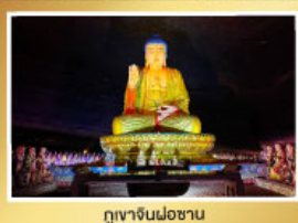
ภูเขาจินฝอซาน