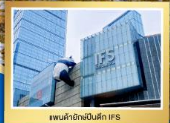
แพนด้ายักษ์ปิ่นดึก IFS