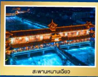
สะพานหนานเจียว