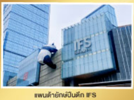
แพนด้ายักษ์บนตึก IFS