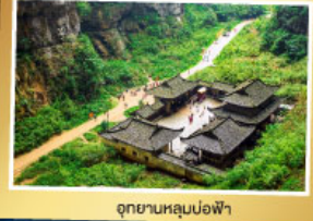
อุทยานหลุมบ่อฟ้า