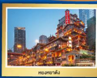
หยงหยาดัง