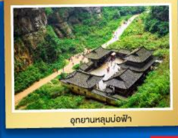
อุทยานหลุมม่อฟ้า