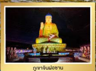
ภูเขาจินฝอซาน