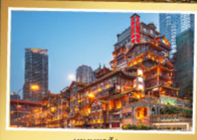
หยงหยาดิง