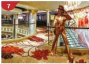
Johnnie Walker House™ Immerse yourself in the intricate world of premium Scotch whisky.