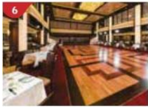
Dream Dining Room Savour a wide variety of Asian and international cuisine.