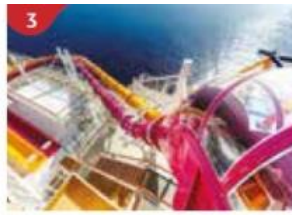
Waterslide Park Get drenched in fun on one of our six different waterslides.