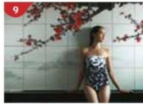
Crystal Life™ Spa Rejuvenate mind, body and soul with our holistic Western and Asian spa experience.