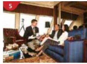
The Palace Indulge in European-style butler service and exclusive facilities.