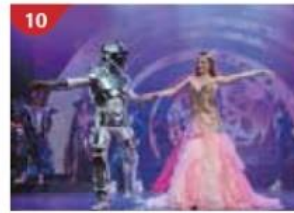
Zodiac Theatre Enjoy live production shows from the acclaimed award-winning entertainment team.