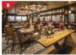
Bistro By Mark Best Relish contemporary Western cuisine from the internationally-acclaimed Australian chef.