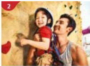
Rock Climbing Wall Challenge yourself on our mountainous rock climbing wall.