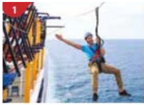
Ropes Course & Zipline Feel the thrill of gliding above the ocean on a 35-metre zipline.