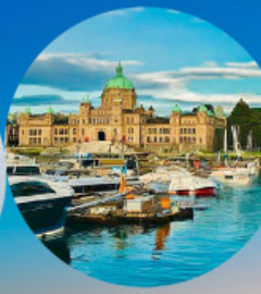
Victoria, British Columbia (Canada)