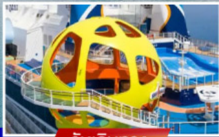
วันเดินทาง