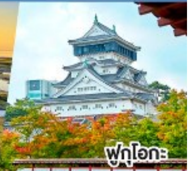
ฟูกูโอกะ