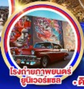
โรงถ่ายภาพยนตร์ ยูนิเวอร์แซล