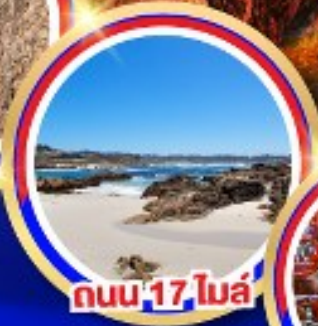
ถนน 17 ไมล์