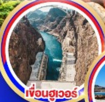
เที่ยวฮิวเวอร์