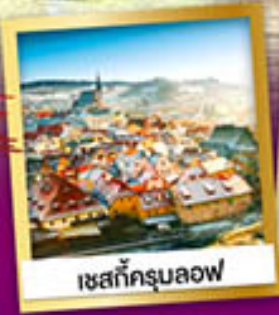
เซสท์กรูบลอฟ