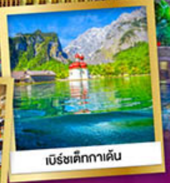
เบียร์ชเต็กกาเดิน