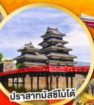
ปราสาทมัสซึโมโด้