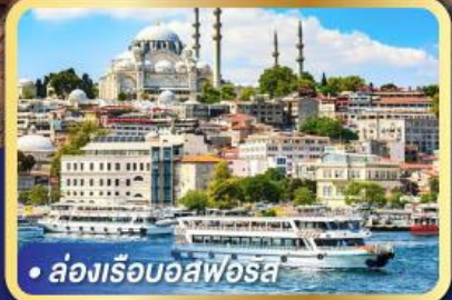
• ล่องเรือออสฟอรส