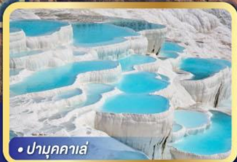
• ปามุกคาล่