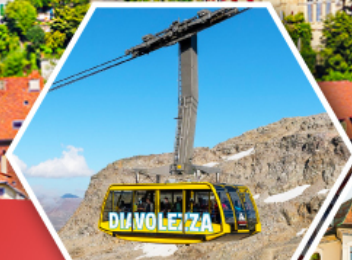
กระเช้าติอาโวลูเซซ่า