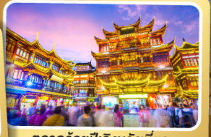
ตลาดร้อยปีเฉิงหวังเหมียว

สนุกสนานไปกับเครื่องเล่น Shanghai Disneyland เต็มวัน