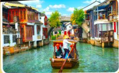
เมืองโบราณซูโจวเจียว