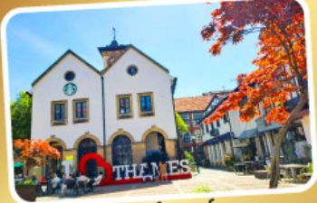
เทมส์ทาวน์