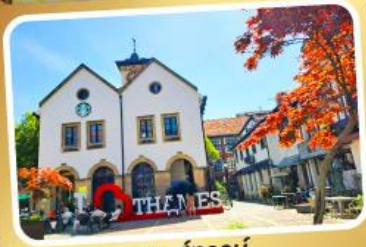
เทมส์ทาวน์