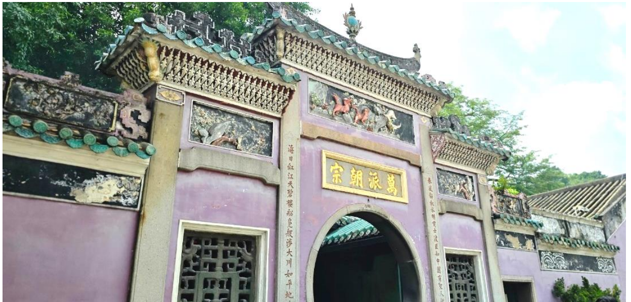
วัฒนธรรมตะวันออกและตะวันตกอย่างลงตัว

นำท่านเดินทางสู่ มาเก๊า (ในการเดินทางข้ามด่าน ท่านจะต้องลากกระเป๋าสัมภาระของท่านเองและผ่านพิธีการตรวจคนเข้าเมืองใช้เวลาในการเดินประมาณ 45-60 นาที) ในอดีตมาเก๊าเป็นเพียงแค่หมู่บ้านเกษตรกรรมและประมงเล็กๆ ซึ่งเป็นเมืองที่มีประวัติศาสตร์ยาวนาน โดยมีชาวจีนกวางตุ้งและฟูเจี้ยนเป็นชนชาติดั้งเดิม จนมาถึงช่วงต้นศตวรรษที่ 16 ชาวโปรตุเกสได้เดินเรือเข้ามายังคาบสมุทรแถบนี้เพื่อติดต่อค้าขายกับชาวจีน และมาสร้างอาณานิคมอยู่ในแถบนี้ ที่สำคัญ คือ ชาวโปรตุเกสได้นำพาเอาความเจริญรุ่งเรืองทางด้านสถาปัตยกรรมและศิลปวัฒนธรรมของชาติตะวันตกเข้ามาอย่างมากมาย ทำให้มาเก๊ากลายเป็นเมืองที่มีการผสมผสานระหว่าง