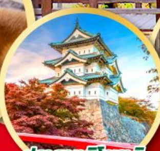
ปราสาทอิโรซากิ