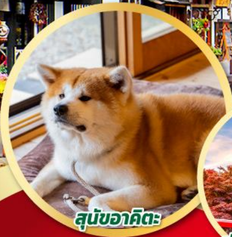
สุนัขอากิตะ