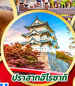
ปราสาทฮิโรซากิ