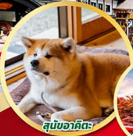
สุนัขอาคิตะ