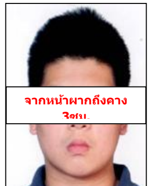
จากหน้าผากถึงคาง 3 ซม.