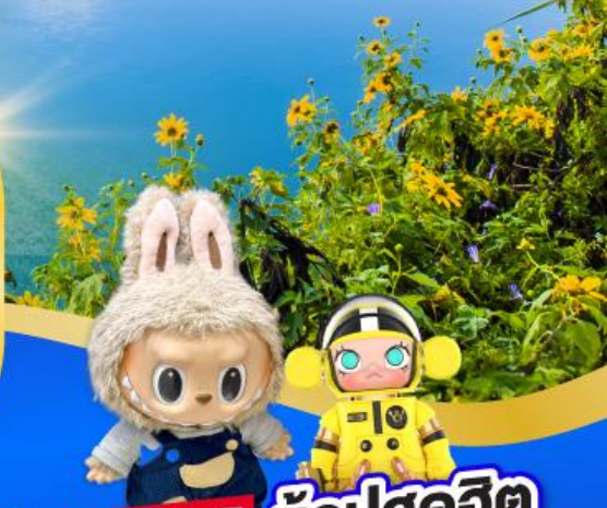
POP MART ช้อปปิ้งสุดฮิต