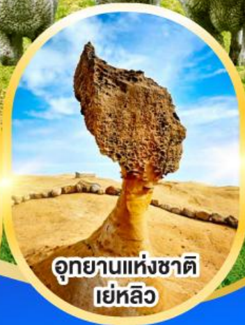
อุทยานแห่งชาติ เย่หลิว