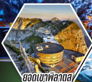
ยอดเขาพิลาตุส