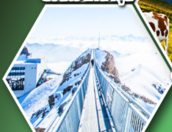
ยอดเขากลาเซียร์ 3000