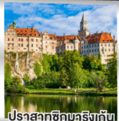
ปราสาทชิกมาริงเก้น