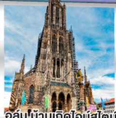
อูล์มบ้านเกิดไอน์สไตน์