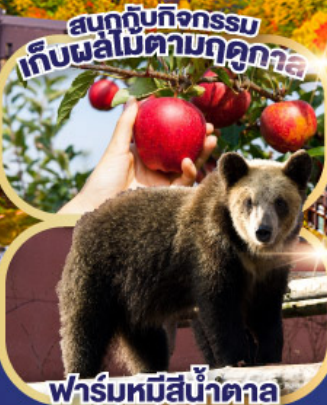
ฟาร์มหมีสีน้ำตาล