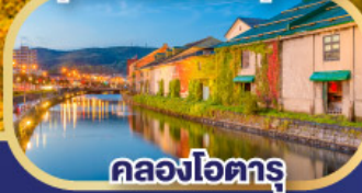
คลองโอดะรุ