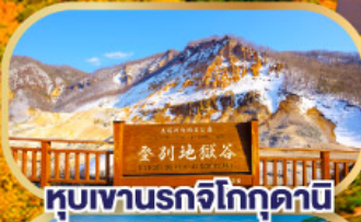
หุบเขานรกจิโกกุคานี

นั่งกระเช้าชมวิวฮาโกดาเตะ (รวมค่ากระเช้า)