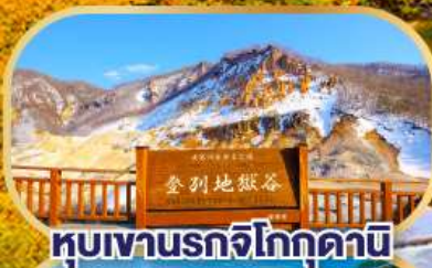
หุบเขานรกจิโกกุคานิ

นั่งกระเช้าชมวิวฮาโกดาเตะ (รวมค่ากระเช้า)