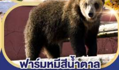
ฟาร์มหมีสีน้ำตาล