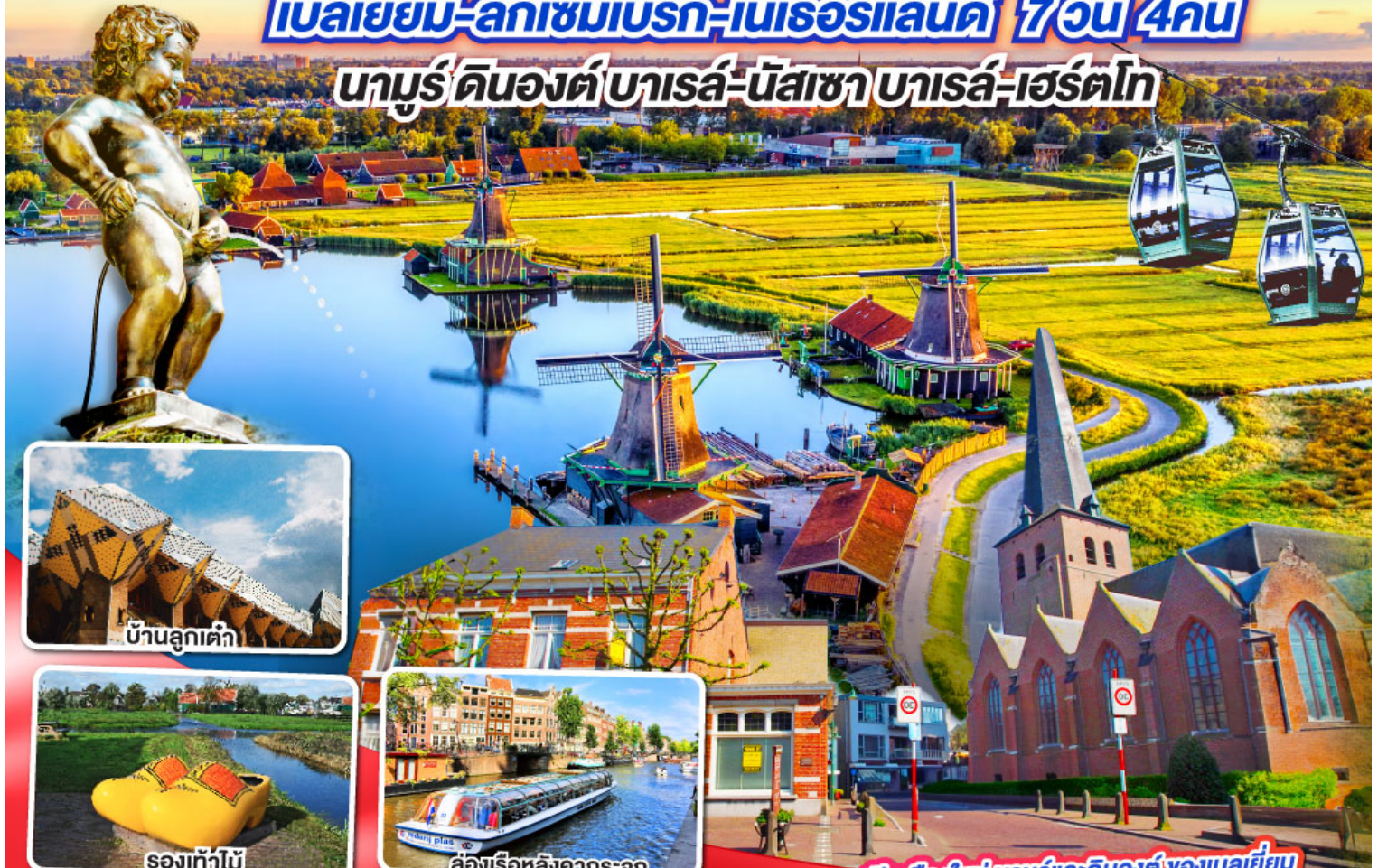
บ้านลูกเต๋