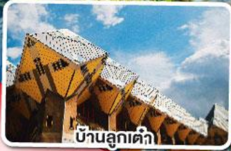
บ้านลูกเต๋า