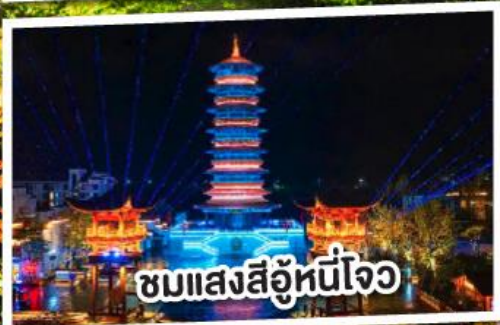
ชมแสงสีอันนี้ใจ