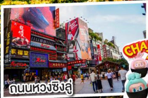
ถนนหลวงชิงลี่