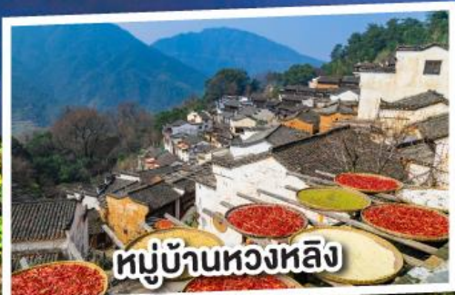
หมู่บ้านหลวงหลัง