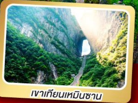
เวาเทียนเหมินซาน

ทริปเดียวเที่ยว 2 เมืองโบราณ ฝูหลงและเฟิ่งหวง