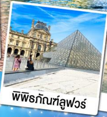
พีพีร์กัทท์ลูฟวร์