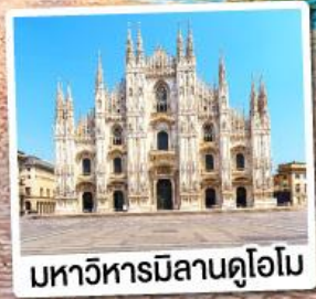
มหาวิหารมิลานดูโอโม

เมนูพิเศษ!! หอยเอสคาโก้ อาหารไทย, ฟองดูชีส