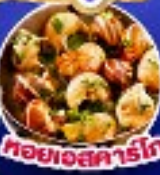
พาทูเมอร์นัม