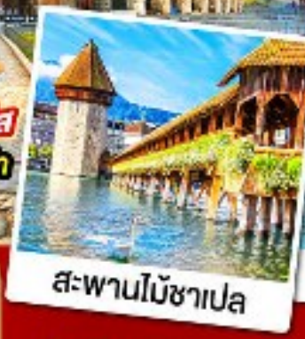
สะพานไม้ซาเปล

18-26 ก.ย. / 28 ก.ย.-06 ต.ค. 67 05-13, 09-17, 12-20 ต.ค. 67 30 พ.ย.-08 ธ.ค. / 08-16 ธ.ค. 67 28 ธ.ค. 67-05 ม.ค. 68 (ปีใหม่)