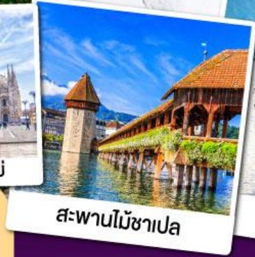
สะพานไม้ซาเปลา