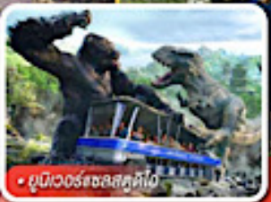
ยูนิเวอร์แซลสตูดิโอ