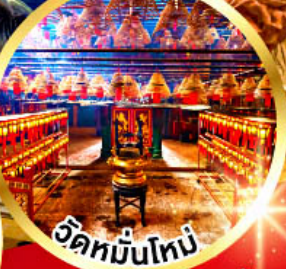
วัดหมื่นใหม่