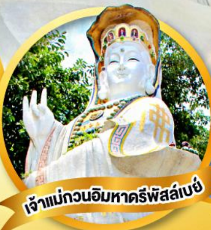
เจ้าแม่กวนอิมหาดรีพีส์ลีย์