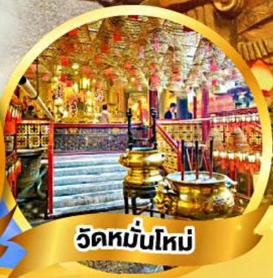
วัดมื่นใหม่