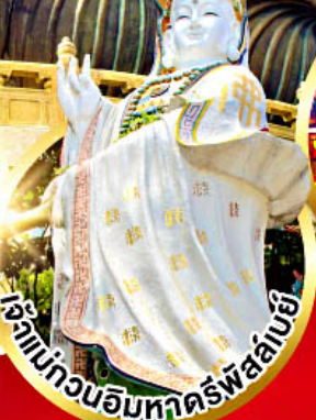
เจ้าแม่กวนอิมหาคีรีพัลลภ