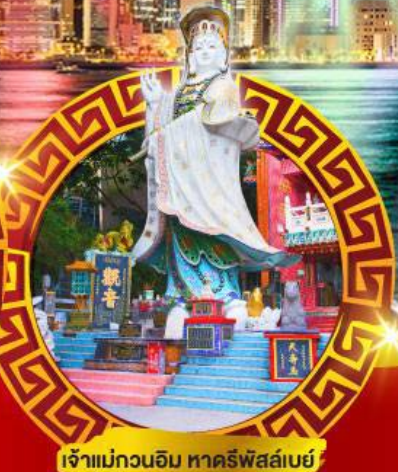
เจ้าแม่กวนอิม ทาครีฟส์ลีย์