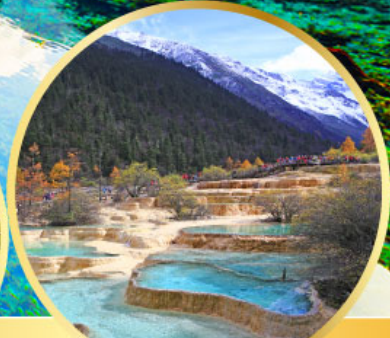
อุทยานหลวงหลง