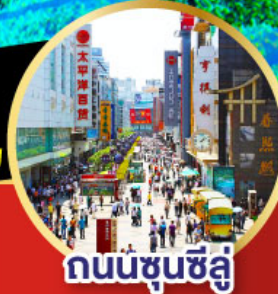
ถนนชุนชิลู่

ห้องพัก 4 ดาว ไม่เข้าร้านช้อปปิ้ง!! -เมนูพิเศษ สุกี้หม่าล่าเสวอน , เปิดปิกนิก