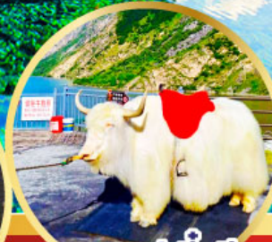
ทะเลสาปเตี้ยซี