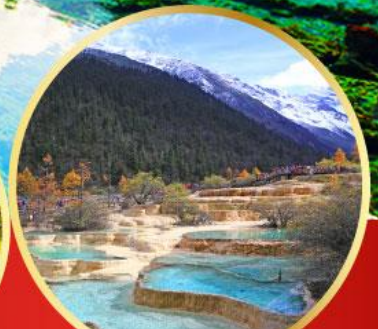
อุทยานหลวงหลง