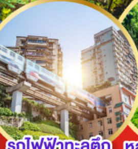
รถไฟฟ้าทะลุคิก หลุมฟ้าสะพานสวรรค์