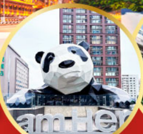
หมีแพนด้าป็นตึก