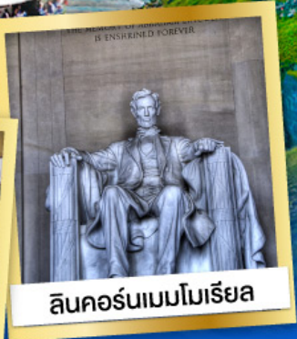
ลินคอล์นเมมโมเรียล