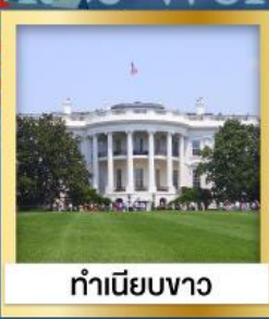
ทำเนียบขาว