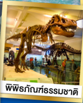
พิพิธภัณฑ์ธรรมชาติ