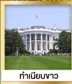
ทำเนียบขาว