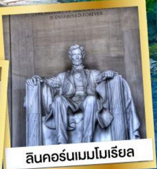
ลินคอร์นเมมโมเรียล