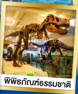
พิพิธภัณฑ์ธรรมชาติ