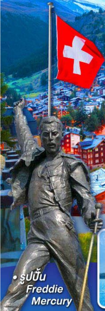
• รูปปั้น Freddie Mercury

พีชิต 5 เวกริก, เวกฮาร์เตอร์คุม, เวกจุงเฟรา เวกลาเซียร์ 3000 และ เวกรอนเนอร์แกรต