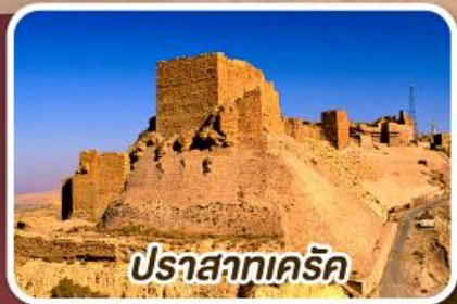
ปราสาทเครีค