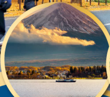
ทะเลสาบคาวากูจิโกะ