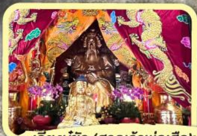
• เอียงบู๊ซัว (ศาลเจ้าพ่อเสือ)