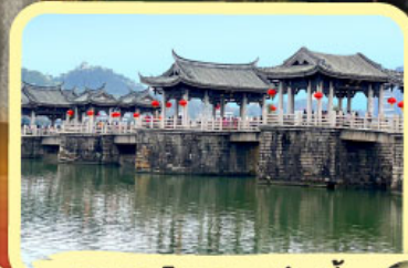
• สะพานโบราณกว้างจี้