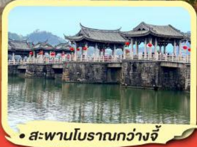
• สะพานโบราณกว้างจี